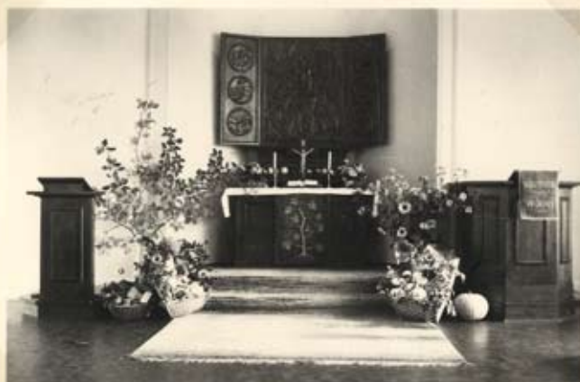
Erntedank im Betsaal.