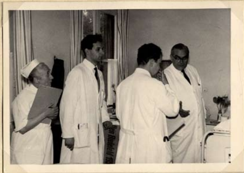
Oberarzt Hauptmeister bei der Visite