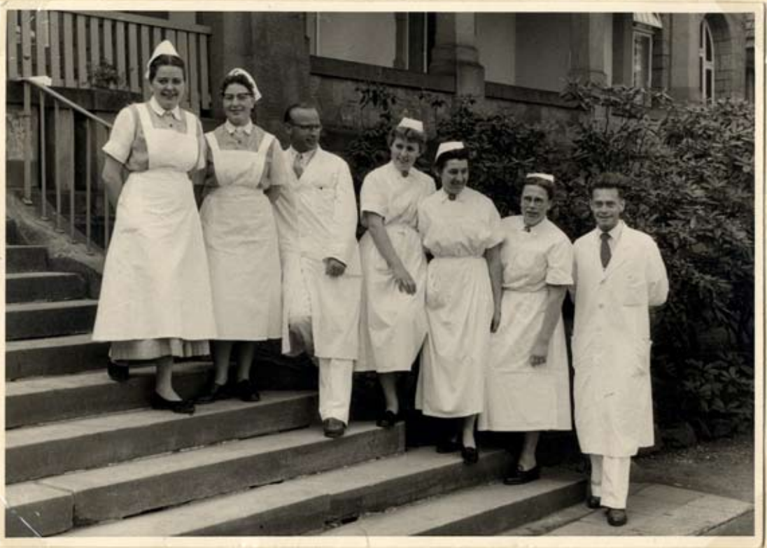
Als Schülerin im 2. Semester