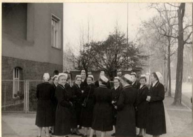
Ein Ausflug in den Grünewald.