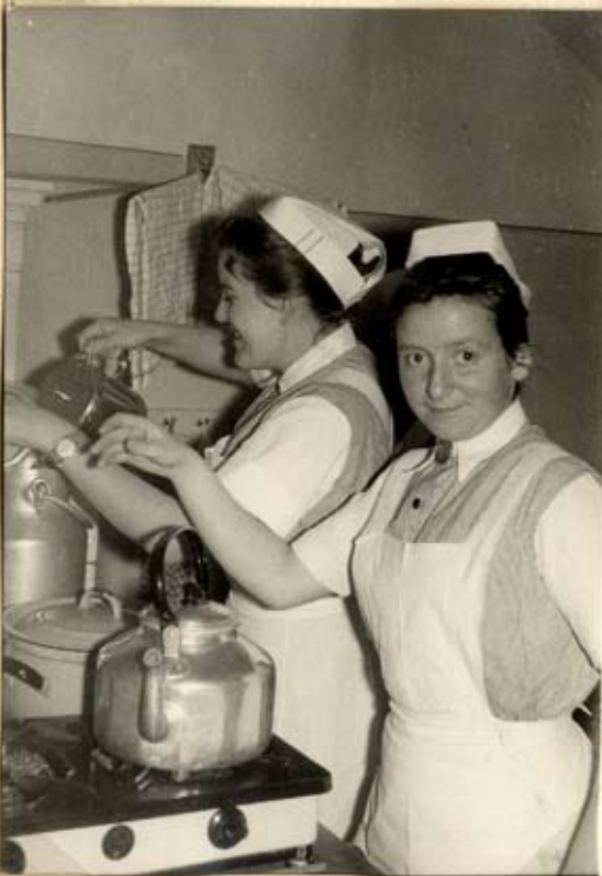
Küchen dienst in der Diakonie-Schule.