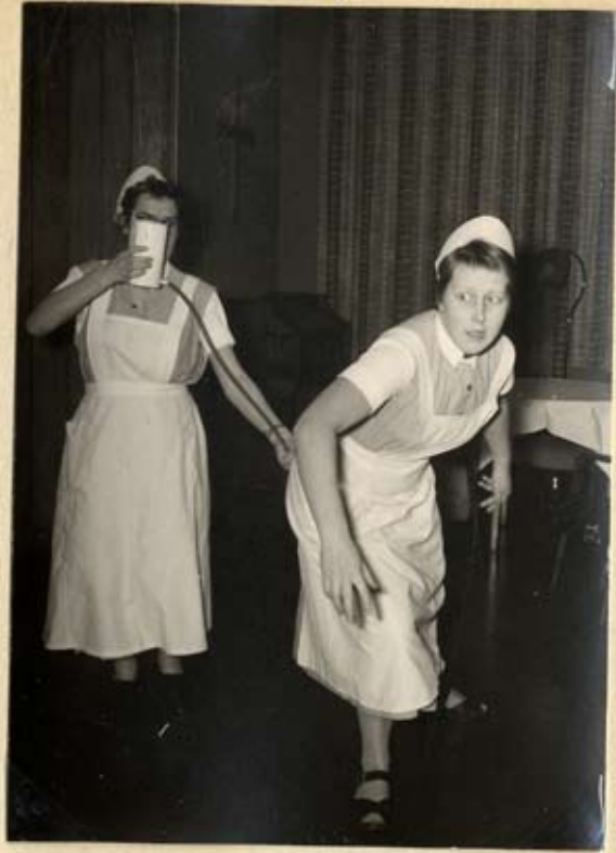
Auf meine Examensfeier, am 20. 2. 1959