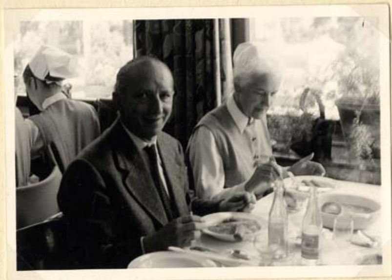
Die Obi... u. der Pro... bei der Erbsensuppe.