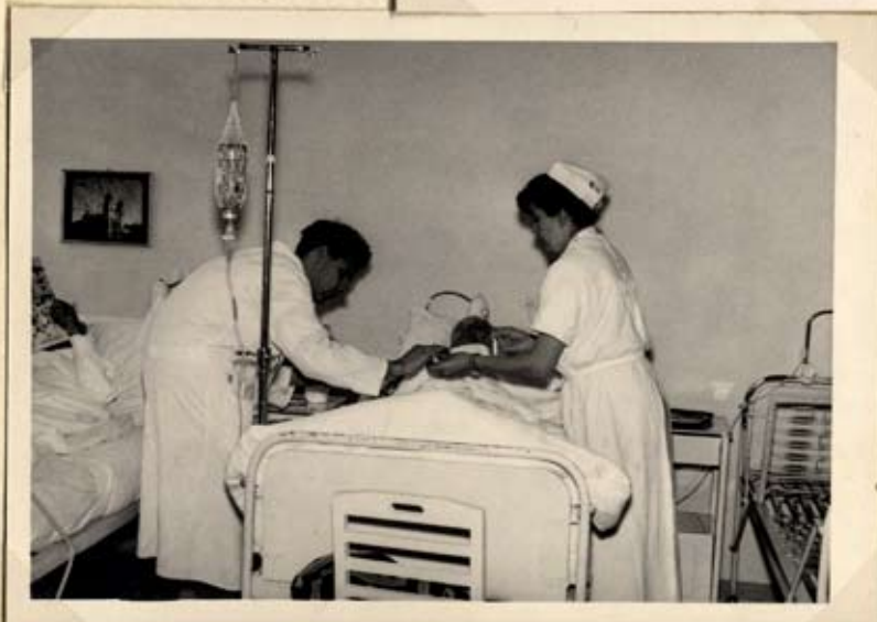
Bitte, hier ist ein Tupfer!