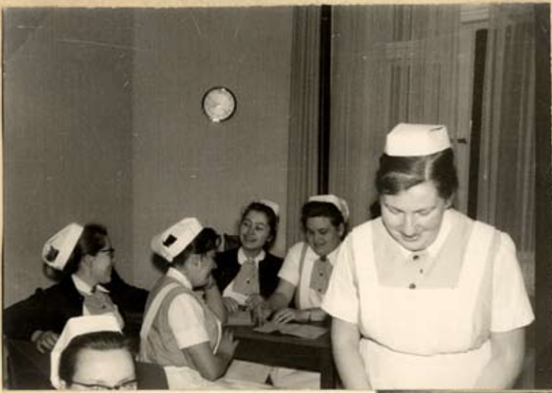
Bei freiem Spiel.