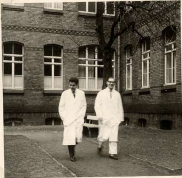
Stat. 1 5 u. die beiden Chirurgen.