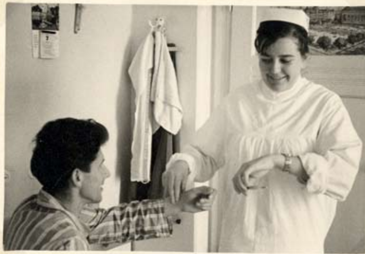
„Der Puls ist ein wenig beschleunigt.“