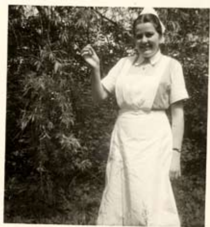
im Teutoburger - Waldkrankenhaus