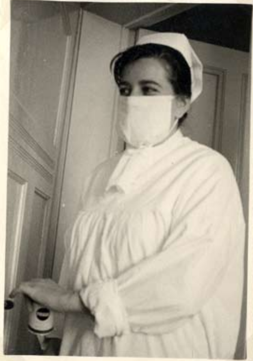
„Wer hat den hier geklingelt?“