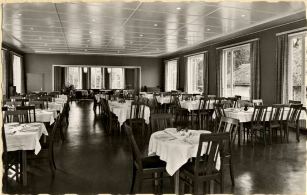
Essaal mit Musikzimmer