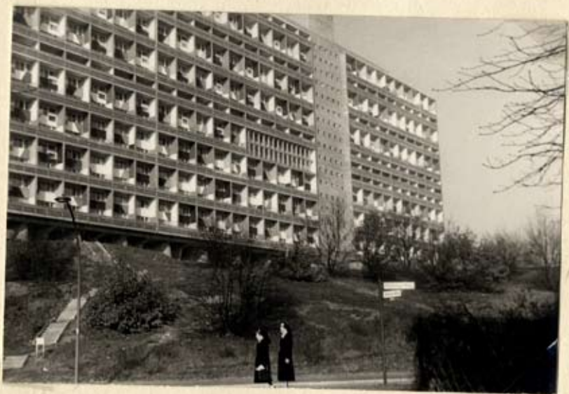
Besuch bei der Gemeindegemeinschaft des Corpus-je-Hauses. (2000 Einwohner)